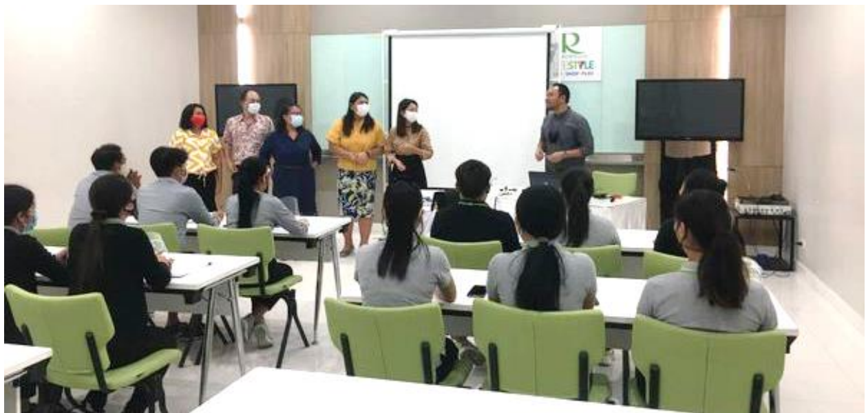
การฝึกยกระดับฝีมือแรงงาน สาขาภาษาอังกฤษเพื่อการทำงาน 30 ชั่วโมง ระหว่างวันที่ 22 - 31 กรกฎาคม 2563 ณ ห้องประชุมห้างสรรพสินค้าโรบินสัน สาขาสุรินทร์ อ.เมือง จ.สุรินทร์