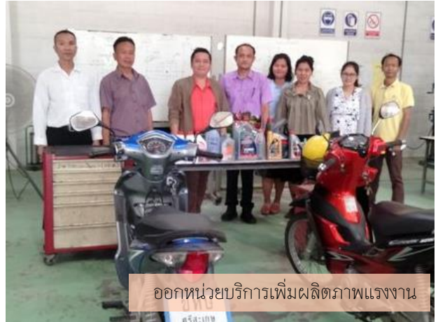
ออกหน่วยบริการเพิ่มผลิตภาพแรงงาน