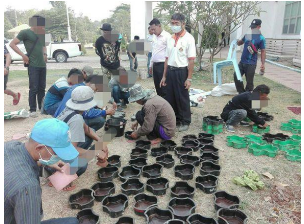
การฝึกอาชีพเสริม สาขาการทำและป้อนด้วยอิฐคอนกรีตตัวหนอน 30 ชั่วโมง ให้แก่กลุ่มผู้ถูกควบคุมความประพฤติ ระหว่างวันที่ 20 - 25 มีนาคม 2563 ณ สำนักงานคุมประพฤติจังหวัดสุรินทร์