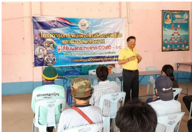
การฝึกยกระดับฝีมือแรงงาน สาขาการบำรุงรักษาเครื่องจักรกลการเกษตร 18 ชั่วโมง ให้แก่กลุ่มเป้าหมายผู้ได้รับผลกระทบจากการแพร่ระบาดของโรคติดเชื้อไวรัสโคโรนา 2019 (COVID-19) จำนวน 20 คน ระหว่างวันที่ 21 - 23 กรกฎาคม 2563 ณ ศาลาประชาคมบ้านตรงจ.ม.1 ต.ตรวจ อ.ศรีณรงค์ จ.สุรินทร์