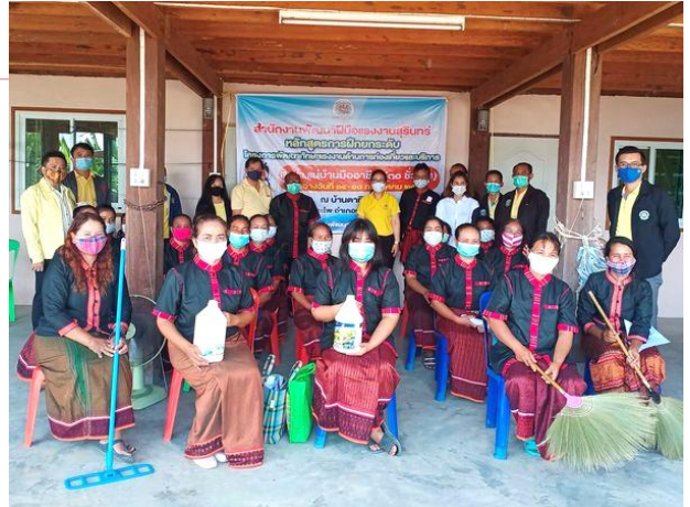
การฝึกยกระดับฝีมือแรงงาน สาขาแม่บ้านมืออาชีพ 30 ชั่วโมง ระหว่างวันที่ 14 – 18 กรกฎาคม 2563 ณ บ้านตาทัพย์ หมู่ 8 ต.กระโพ อ.ท่าตูม จ.สุรินทร์