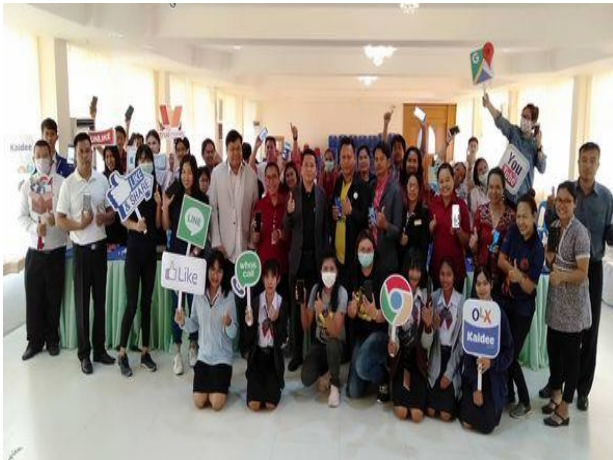
การฝึกยกระดับฝีมือแรงงาน สาขาการตลาดออนไลน์ด้วยโมบายแอปพลิเคชัน 30 ชั่วโมง ระหว่างวันที่ 10 - 13 มีนาคม 2563 ณ ห้องประชุมวิทยาลัยสารพัดช่างสุรินทร์ อ.เมือง จ.สุรินทร์

เพื่อให้แรงงานไทยได้รับการยกระดับ(Upskill) และมีขีดความสามารถในการปฏิบัติงาน มีทักษะ องค์ความรู้ สอดคล้องกับความต้องการของตลาดแรงงานและความก้าวหน้าของเทคโนโลยี มีโอกาสในการปรับเปลี่ยนอาชีพ แผนงาน ได้ตรงกับทักษะฝีมือ รวมทั้งเพิ่มโอกาสในการทำงานให้กับผู้ว่างงาน แรงงานฝีมือสูงชัน ได้รับค่าจ้างตามสมรรถนะและฝีมือ ตามความต้องการของนายจ้าง รวมทั้งให้แรงงานนอกพื้นที่ EEC มีทักษะฝีมือรองรับเทคโนโลยีชั้นสูง รองรับบริการเคลื่อนย้ายมาทำงานในพื้นที่ EEC รองรับการลงทุนในอุตสาหกรรมและการบริการ ที่ใช้เทคโนโลยีชั้นสูง ในช่วงต้นปี พ.ศ. 2563 กรมพัฒนาฝีมือแรงงานได้ปรับเปลี่ยนเป้าหมายการฝึกอบรมเป็นผู้ได้รับผลกระทบจากการแพร่ระบาดของโรคติดเชื้อไวรัสโคโรนา 2019 ผลการปฏิบัติงานปีงบประมาณ พ.ศ. 2563 มีผู้ผ่านการฝึกอบรมฝีมือแรงงาน จำนวน 15 รุ่น จำนวน 343 คน