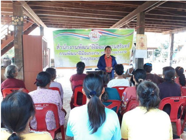
การฝึกอาชีพเสริม สาขาการย้อมเส้นไหมด้วยสีธรรมชาติ 30 ชั่วโมง ตามโครงการอันเนื่องมาจากพระราชดำริ ระหว่างวันที่ 12-16 มีนาคม 2563 ณ บ้านโพหนอง ต.ต่าน อ.กาบเชิง จ.สุรินทร์

เพื่อให้แรงงานกลุ่มเป้าหมายเฉพาะ (กลุ่มผู้ผ่านการบำบัดยาเสพติด, กลุ่มผู้ต้องขังและเยาวชนในสถานพินิจ, แรงงานนอกระบบ, แรงงานโครงการอันเนื่องมาจากพระราชดำริ) ที่ผ่านการฝึกอบรมสามารถนำความรู้ ทักษะที่ได้รับไปสร้างโอกาสในการประกอบอาชีพ มีงานทำในระบบการจ้างงาน และการประกอบอาชีพอิสระ สามารถแบ่งเบาภาระค่าใช้จ่ายในครอบครัวสร้างความภาคภูมิใจให้กับตัวกลุ่มเป้าหมายเอง ตลอดจนสังคมให้การยอมรับในคุณค่าและศักดิ์ศรีความเป็นมนุษย์ ผลการปฏิบัติงานปีงบประมาณ พ.ศ. 2563 มีผู้ผ่านการฝึกอบรมฝีมือแรงงาน จำนวน 7 รุ่น จำนวน 214 คน