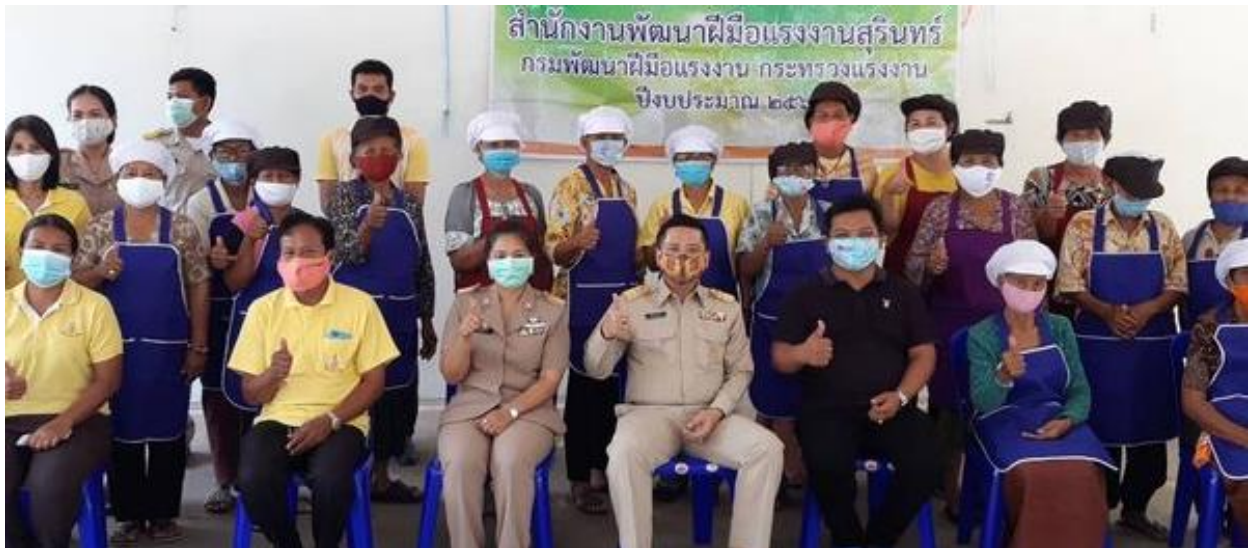
การฝึกอบรมอาชีพเสริม สาขาการแปรรูปอาหาร 30 ชั่วโมง ระหว่างวันที่ 13 – 17 กรกฎาคม 2563 ณ เทศบาลตำบลเมืองที่ ต.เมืองที่ อ.เมือง จ.สุรินทร์