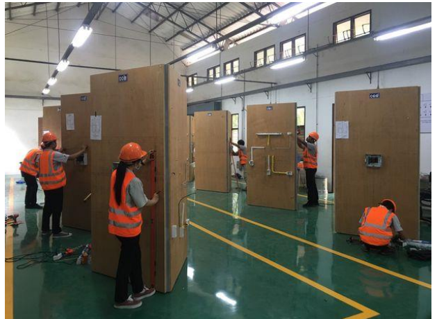
การทดสอบมาตรฐานฝีมือแรงงานแห่งชาติ สาขาช่างไฟฟ้าภายในอาคาร ระดับ 1 วันที่ 17 มิถุนายน 2563 ณ สำนักงานพัฒนาฝีมือแรงงานสุรินทร์ อ.เมือง จ.สุรินทร์