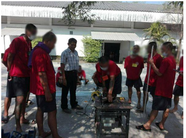
การฝึกอาชีพเสริม สาขาการทำมุ้งลวด 18 ชั่วโมง ให้แก่ผู้ต้องขัง จำนวน 25 คน ระหว่างวันที่ 21 - 23 มกราคม 2563 ณ กองร้อยอาสาสมัครชาตินแดนจังหวัดสุรินทร์