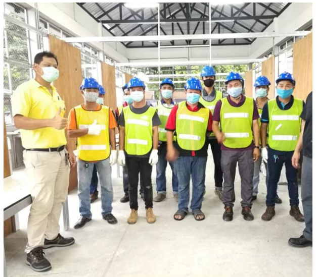
การทดสอบมาตรฐานฝีมือแรงงานแห่งชาติ ภาคความรู้ (E-Testing) และภาคปฏิบัติ สาขาช่างเครื่องปรับอากาศในบ้านและการพาณิชย์ขนาดเล็ก ระดับ 1 วันที่ 8 และ 9 กรกฎาคม 2563 ณ คณะเกษตรศาสตร์และเทคโนโลยี มหาวิทยาลัยเทคโนโลยีราชมงคลอีสาน วิทยาเขตสุรินทร์