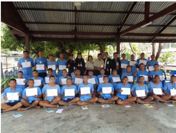
การฝึกอาชีพเสริม สาขาช่างประเบื้อง 30 ชั่วโมง ให้แก่ผู้ต้องขัง จำนวน 30 คน ระหว่างวันที่ 27 - 31 มกราคม 2563 ณ เรือนจำกลางสุรินทร์ อ.เมือง จ.สุรินทร์