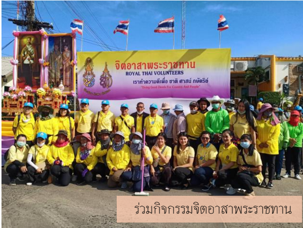
ร่วมกิจกรรมจิตอาสาพระราชทาน