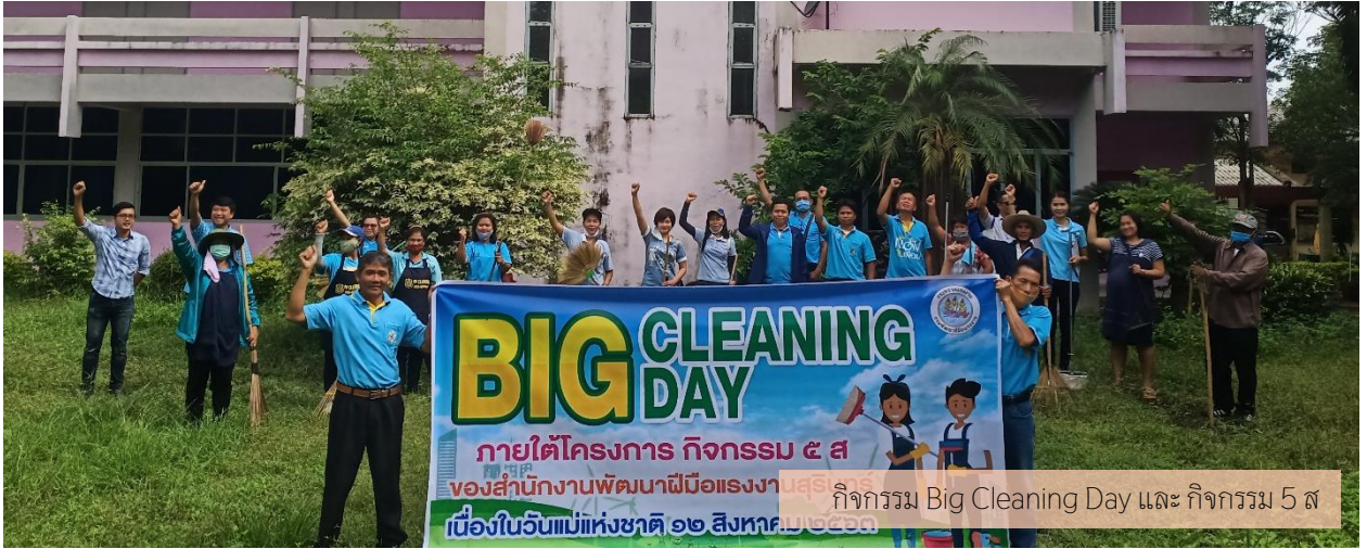
กิจกรรม Big Cleaning Day และ กิจกรรม 5 ส