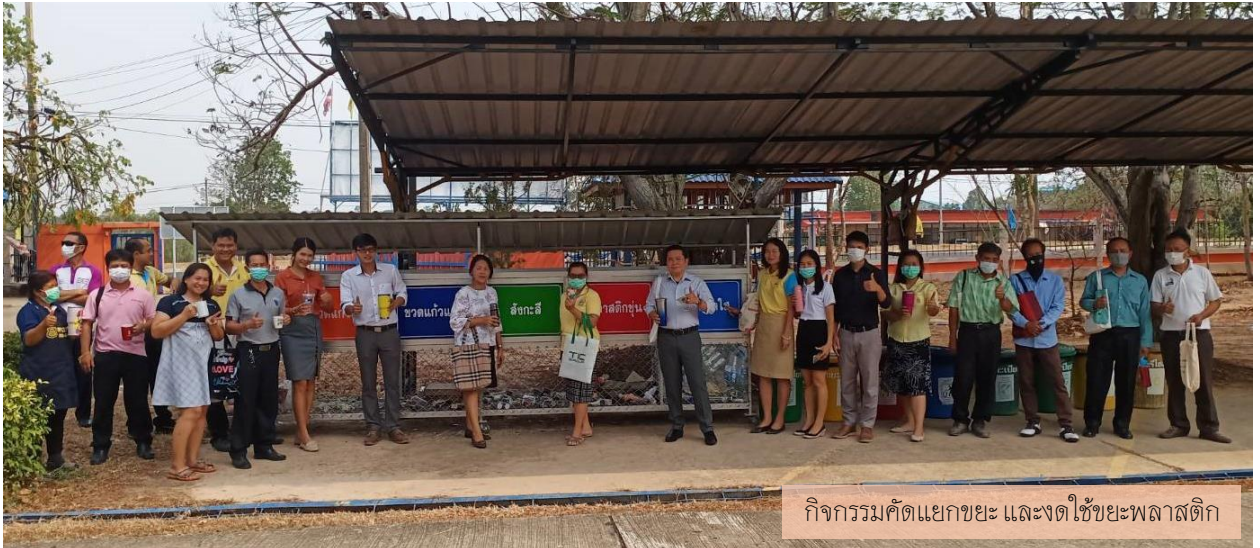
กิจกรรมคัดแยกขยะ และงดใช้ขยะพลาสติก