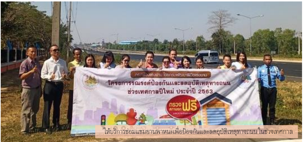
ให้บริการซ่อมแซมยานพาหนะเพื่อป้องกันและลดอุบัติเหตุทางถนน ในช่วงเทศกาล ในช่วงเทศกาล