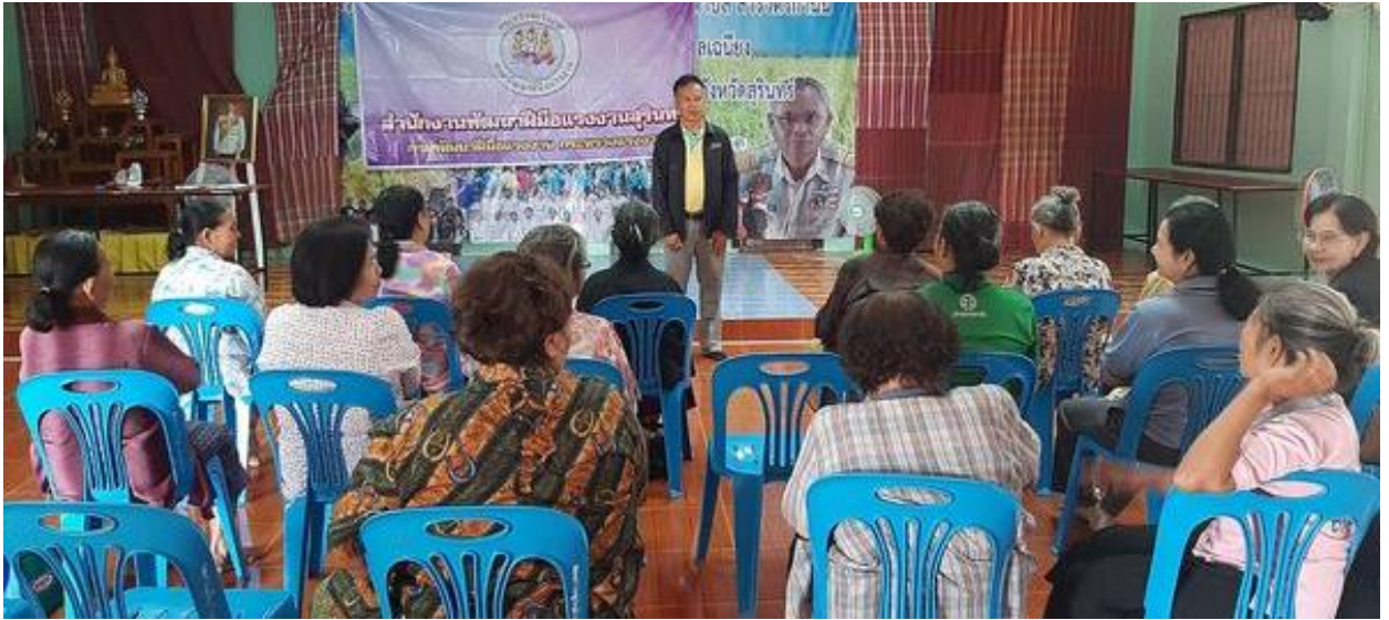
การฝึกอาชีพเสริม สาขาการทำกระเป๋าสานจากเส้นพลาสติก 30 ชั่วโมง ระหว่างวันที่ 17 – 21 กุมภาพันธ์ 2563 ณ ชมรมกำนันผู้ใหญ่บ้าน หมู่ 17 ต.เจนิยง อ.เมือง จ.สุรินทร์

เพื่อให้ผู้สูงอายุที่ผ่านการฝึกอบรมอาชีพ สามารถนำความรู้ ทักษะที่ได้รับไปสร้างโอกาสในการมีอาชีพ มีรายได้ ตามกำลังความสามารถ พึ่งพาตนเองและแบ่งเบาภาระของครอบครัวได้ เป็นการส่งเสริมและพัฒนาคุณภาพกลุ่มผู้สูงอายุรองรับการเข้าสู่สังคมผู้สูงอายุ(Aging society) ผลการปฏิบัติงานปีงบประมาณ พ.ศ. 2563 มีผู้ผ่านการฝึกอบรมฝีมือแรงงาน จำนวน 4 รุ่น จำนวน 80 คน