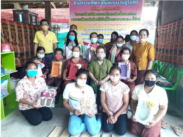
การฝึกยกระดับฝีมือแรงงาน สาขาการผลิตภัตตาคารให้เป็นที่ต้องการของตลาด 30 ชั่วโมง ระหว่างวันที่ 13 – 17 กรกฎาคม 2563 ณ บ้านโสมน หมู่ 5 ต.บัวโคก อ.ท่าตูม จ.สุรินทร์

เพื่อพัฒนาศักยภาพแรงงานให้มีทักษะสอดคล้องกับความต้องการของตลาดแรงงานด้านการท่องเที่ยว Upskill และ Reskill พร้อมรองรับการเปลี่ยนแปลงของเทคโนโลยี เพิ่มขีดความสามารถด้านการท่องเที่ยว ผลการปฏิบัติงานปีงบประมาณ พ.ศ. 2563 มีผู้ผ่านการฝึกอบรมฝีมือแรงงาน จำนวน 3 รุ่น 60 คน