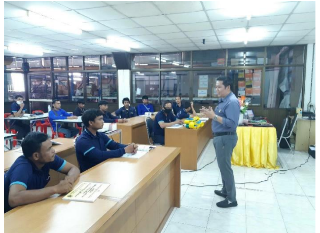
การฝึกยกระดับฝีมือแรงงาน สาขาผู้ควบคุมการใช้บันจันชนิดเหนือศีรษะ 30 ชั่วโมง ระหว่างวันที่ 20 - 25 มีนาคม 2563 ณ บริษัทเจริญไชยสุรินทร์คัลสติลลิก จำกัด อ.เมือง จ.สุรินทร์