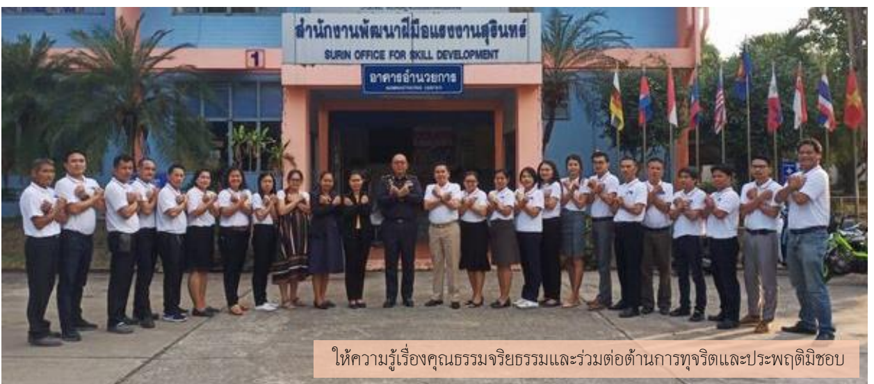
ให้ความรู้เรื่องคุณธรรมจริยธรรมและร่วมต่อต้านการทุจริตและประพฤติมิชอบ