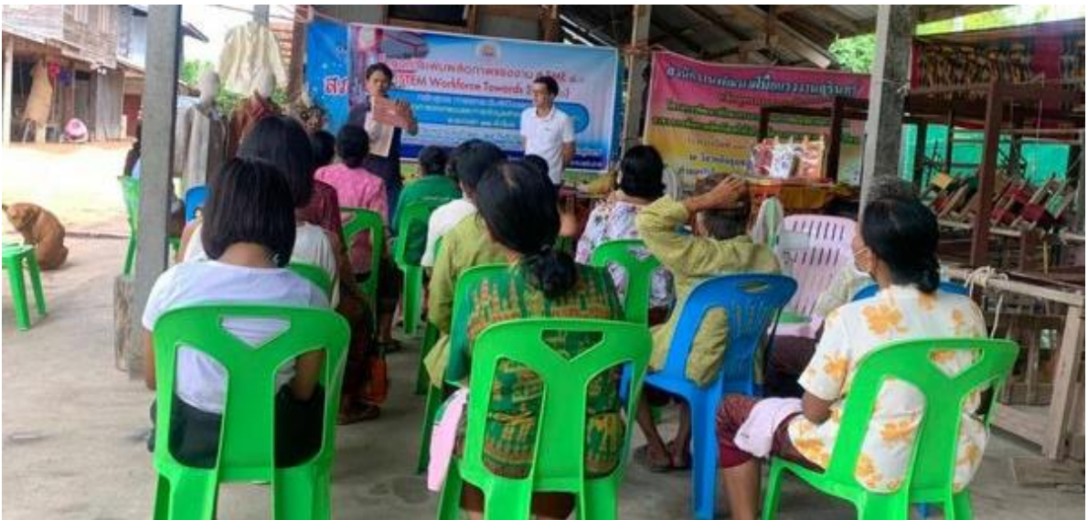
การฝึกยกระดับฝีมือแรงงาน สาขการออกแบบและการจัดบูธสำหรับงานแสดงสินค้า 12 ชั่วโมง ระหว่างวันที่ 13 – 14 กันยายน 2563 ณ ที่ทำการกลุ่มวิสาหกิจชุมชนบ้านโสมน หมู่ที่ 5 ต.บัวโคก อ.ท่าตูม จ.สุรินทร์