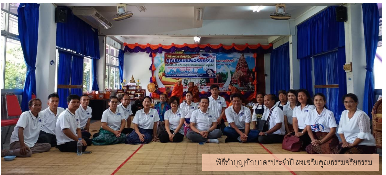
พิธีทำบุญตักบาตรประจำปี ส่งเสริมคุณธรรมจริยธรรม