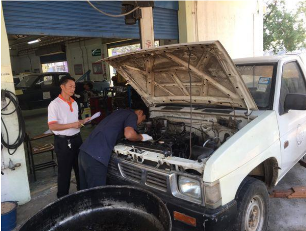
การทดสอบมาตรฐานฝีมือแรงงานแห่งชาติ สาขาช่างซ่อมรถยนต์ ระดับ 1 วันที่ 6 กุมภาพันธ์ 2563 ณ สำนักงานพัฒนาฝีมือแรงงานสุรินทร์ อ.สังขะ จ.สุรินทร์

กิจกรรมการทดสอบมาตรฐานฝีมือแรงงานแห่งชาติ เพื่อให้แรงงานมีความรู้ ความเข้าใจเกี่ยวกับมาตรฐานฝีมือแรงงาน และพัฒนาฝีมือของตนเองให้ได้มาตรฐาน สามารถเข้าสู่ตลาดแรงงานในภาคอุตสาหกรรมทั้งในและต่างประเทศได้ และมีโอกาสในการสร้างรายได้เพิ่มมากขึ้น ผลการปฏิบัติงานปีงบประมาณ พ.ศ. 2563 มีผู้เข้ารับการทดสอบมาตรฐานฝีมือแรงงานแห่งชาติ จำนวน 292 คน