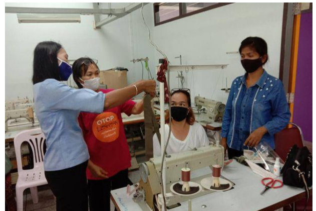
การฝึกยกระดับฝีมือแรงงาน สาขาการแปรรูปผลิตภัณฑ์จากผ้า 18 ชั่วโมง ให้แก่กลุ่มเป้าหมายผู้ได้รับผลกระทบจากการแพร่ระบาดของโรคติดเชื้อไวรัสโคโรนา 2019 (COVID-19) จำนวน 20 คน ระหว่างวันที่ 16 - 18 มิถุนายน 2563 ณ สำนักงานพัฒนาฝีมือแรงงานสุรินทร์ อ.สังขะ จ.สุรินทร์