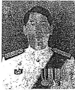
นายอนุวัฒน์ ธาราแสง ตุลาการหัวหน้าคณะศาลปกครองชั้นต้น ประจำศาลปกครองสูงสุด