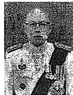
นายมานิตย์ วงศ์เสรี ตุลาการหัวหน้าคณะศาลปกครองกลาง