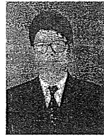
นายกมล สกลดเตชา อธิบดีศาลปกครองขอนแก่น