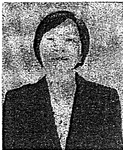
นางสิริกาญจน์ พานพิทักษ์ รองอธิบดีศาลปกครองกลาง