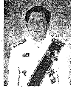
นายกฤษฎา บุญราช ปลัดกระทรวงมหาดไทย