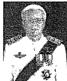
นายรัฐกิจ มานะทัต อดีตเอกอัครราชทูต ณ กรุงอังการา ประเทศตุรกี สำนักงานปลัดกระทรวงการต่างประเทศ