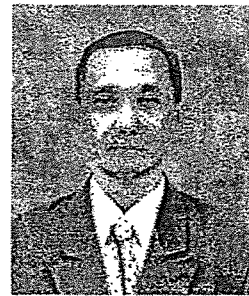
นายสุชาติ ศรีวรรกร ตุลาการหัวหน้าคณะศาลปกครองกลาง