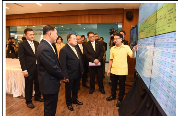
รายงานแบบปฏิบัติการฝึกทักษะอาชีพ โครงการเพิ่มศักยภาพผู้มีรายได้น้อยที่ลงทะเบียนสวัสดิการแห่งรัฐ เพื่อสร้างงาน สร้างอาชีพ เพราะรายได้และความเป็นสิริสวัสดิ ประจำปี 17 กันยายน 2561 ( ปรับปรุงข้อมูลล่าสุด เวลา 18.00 น.)

นอกจากนั้นแล้วระบบสารสนเทศที่ได้พัฒนาขึ้น ยังได้ใช้ในการนำเสนอผลการดำเนินงานโครงการแก่ พลเอก ประวิตร วงษ์สุวรรณ รองนายกรัฐมนตรีและรัฐมนตรีว่าการกระทรวงกลาโหม และ พลตำรวจเอกอดุลย์ แสงสิงแก้ว รัฐมนตรีว่าการกระทรวงแรงงาน ณ ศูนย์ปฏิบัติการกระทรวงแรงงาน (ศป.ปร.ง.) ชั้น 5 อาคารกระทรวงแรงงาน เมื่อวันที่ 5 กรกฎาคม 2561 ที่ผ่านมา