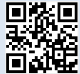
QR Code แบบประเมินความพึงพอใจ