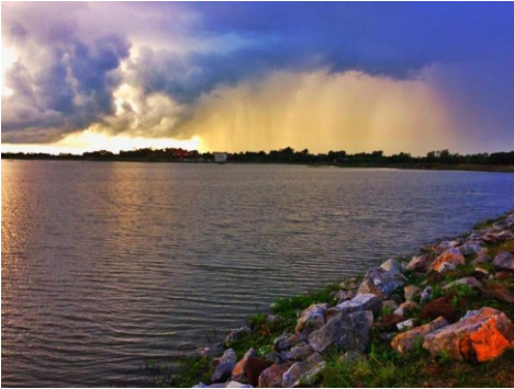
แก่งเลิงจาน อ.เมืองมหาสารคาม