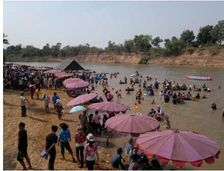
หาดวังโก อ.เมืองมหาสารคาม