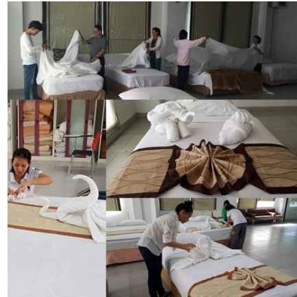
ฝึกรอบรมหลักสูตรยกระดับฝีมือ แผนกแม่บ้าน ตำแหน่งพนักงานดูแลห้องพัก (30 ช.ม.)