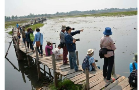
สะพานไม้แกดำ อ.แกดำ