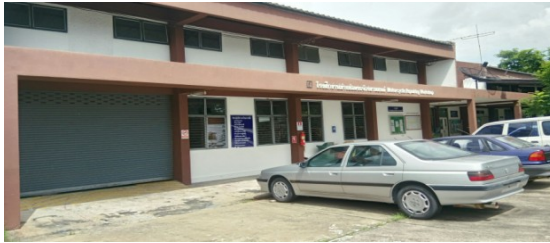
โรงฝึกงานช่างซ่อมรถจักรยานยนต์