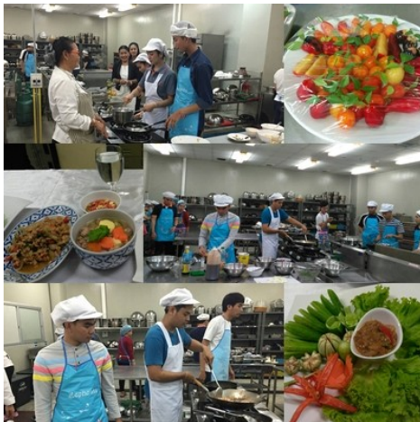
ฝึกรอบรมหลักสูตร ยกระดับฝีมือ สาขา ผู้ประกอบการอาหารไทย (30 ช.ม.)