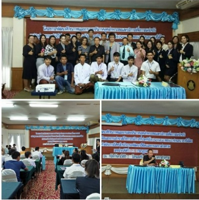
ฝึกรอบรมหลักสูตรยกระดับ ฝีมือ สาขา การบริการที่ ประทับใจ (18 ช.ม.)