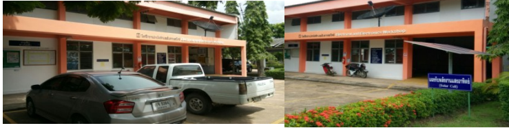
โรงฝึกงานช่างไฟฟ้าและอิเล็กทรอนิกส์