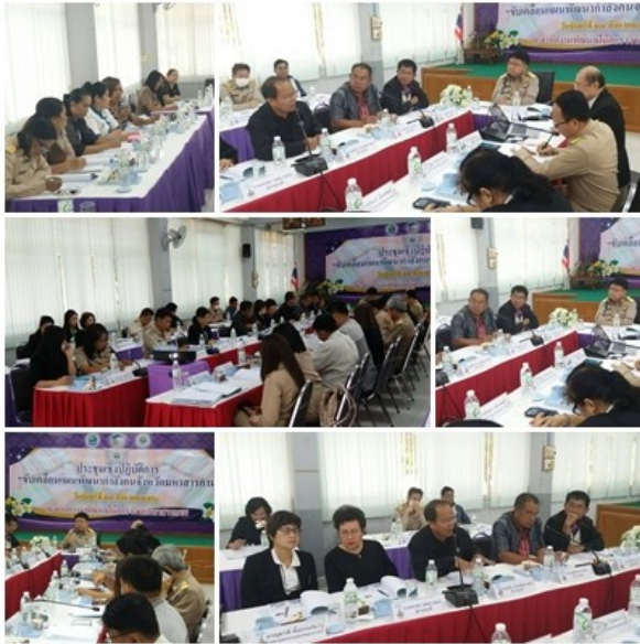
ประชุมคณะทำงานขับเคลื่อนแผนพัฒนากำลังคนจังหวัด มหาสารคาม