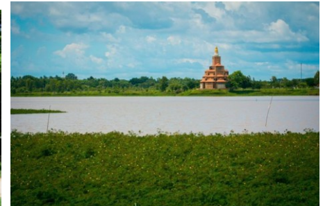
สะดืออีสาน อ.โกสุมพิสัย