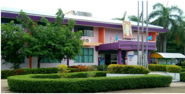
อาคารอำนวยการ