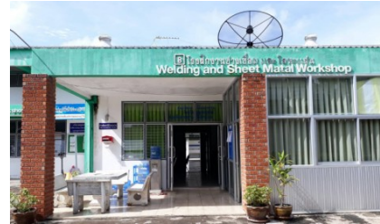
โรงฝึกงานช่างเชื่อม