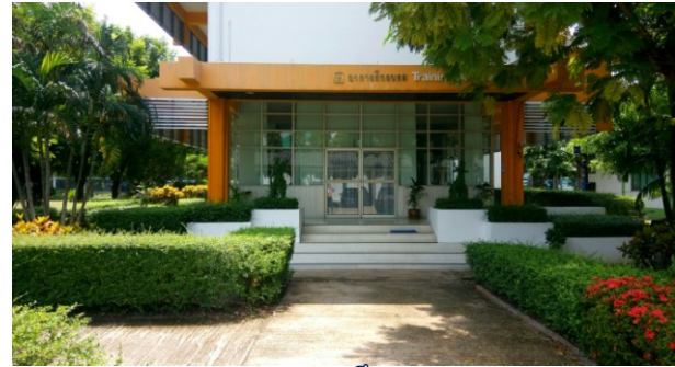
อาคารฝึกอบรม