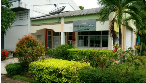
ห้องพัฒนาการเรียนรู้