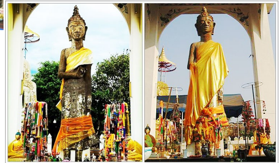
พระพุทธรูปมิ่งเมือง อ.กันทรวิชัย