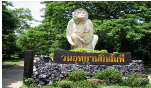
วนอุทยานโกสัมพี อ.โกสุมพิสัย