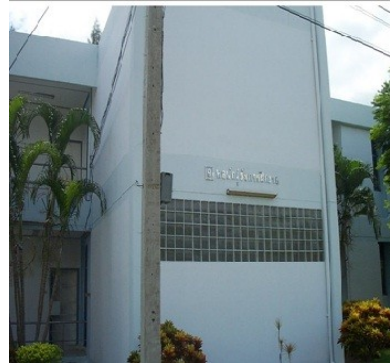
หอพักผู้รับการศึกษา