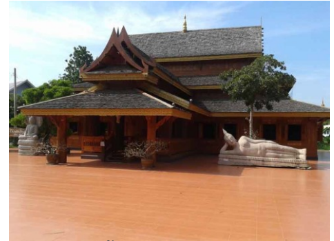
วัดป่าวังน้ำเย็น อ.เมืองมหาสารคาม