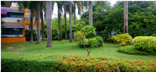
บริเวณภายใน สำนักงานฯ