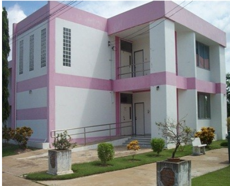
หอพักผู้รับการศึกษา