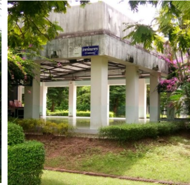
โรงอาหาร