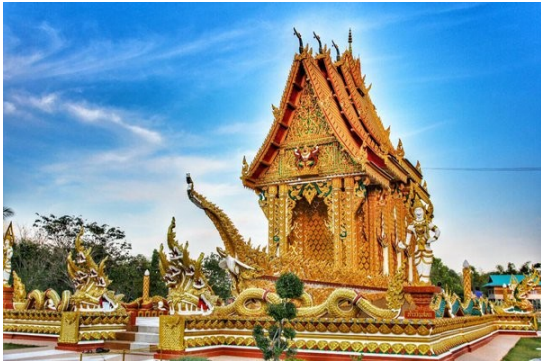
วัดหนองหูลิง อ.แกลง