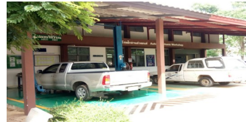
โรงฝึกงานช่างซ่อมเครื่องยนต์