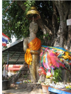
พระพุทธรูปยืนมงคล อ.กันทรวิชัย