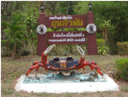
ป่าดูลำพัน อ.นาเชือก