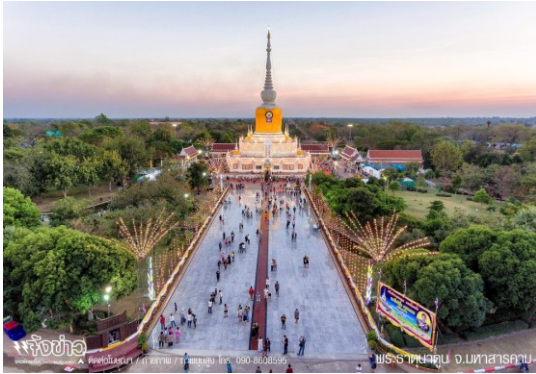
พระธาตุนาดูน อ.นาดูน