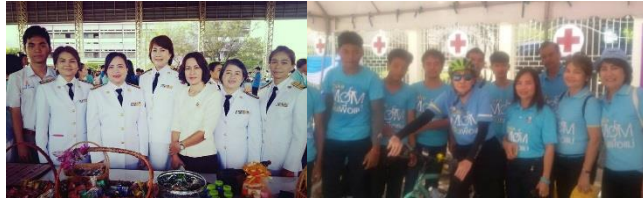
ถวายพระพรชัยมงคล