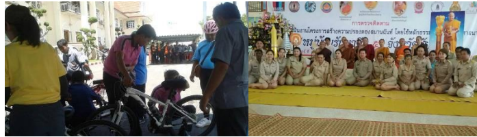
บริการตรวจเช็คจักรยานรับโครงการ "Bike for Mom ปั่นเพื่อแม่"