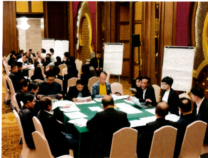
กลุ่มอุตสาหกรรมการบินและโลจิสติกส์