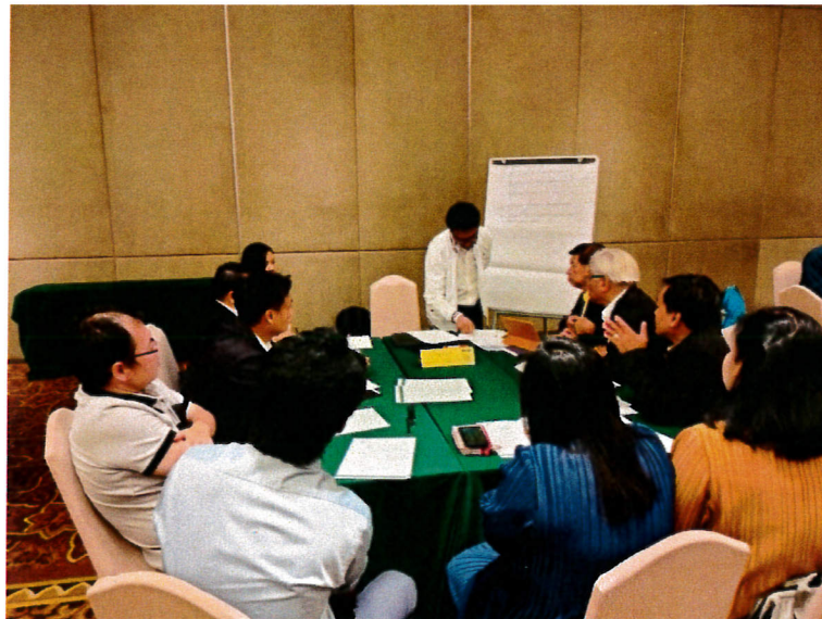
กลุ่มเกษตรและเทคโนโลยีชีวภาพ