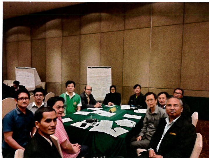
กลุ่มอุตสาหกรรมอิเล็กทรอนิกส์อัจฉริยะ