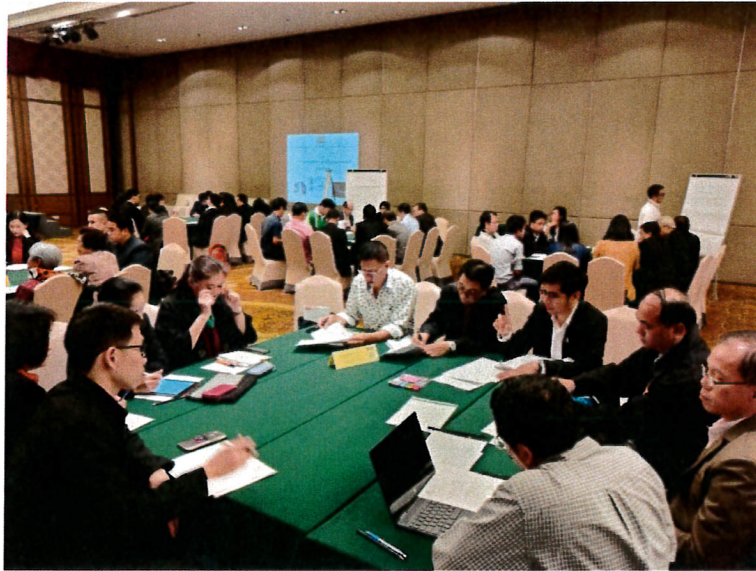
กลุ่มอุตสาหกรรมการแปรรูปอาหาร