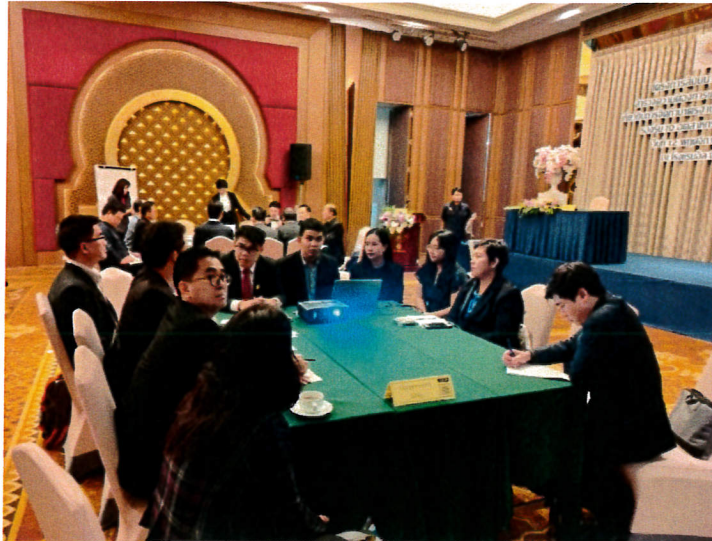
กลุ่มอุตสาหกรรมดิจิทัล