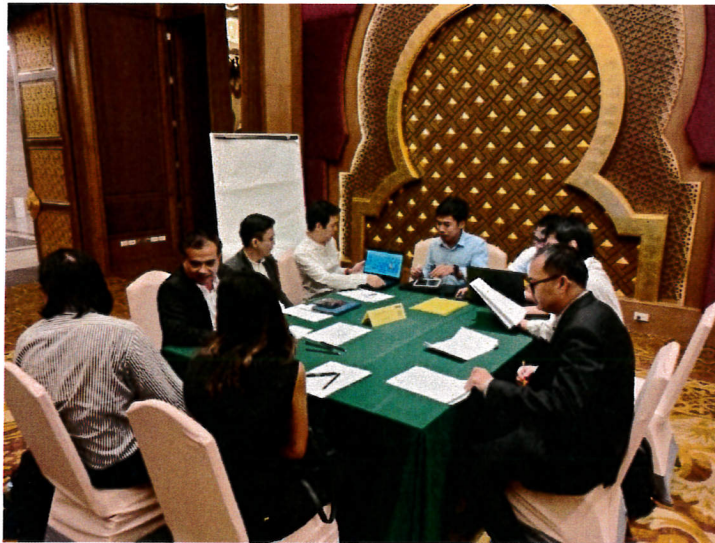
กลุ่มอุตสาหกรรมหุ่นยนต์