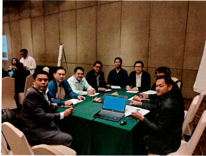
กลุ่มอุตสาหกรรมยานยนต์สมัยใหม่