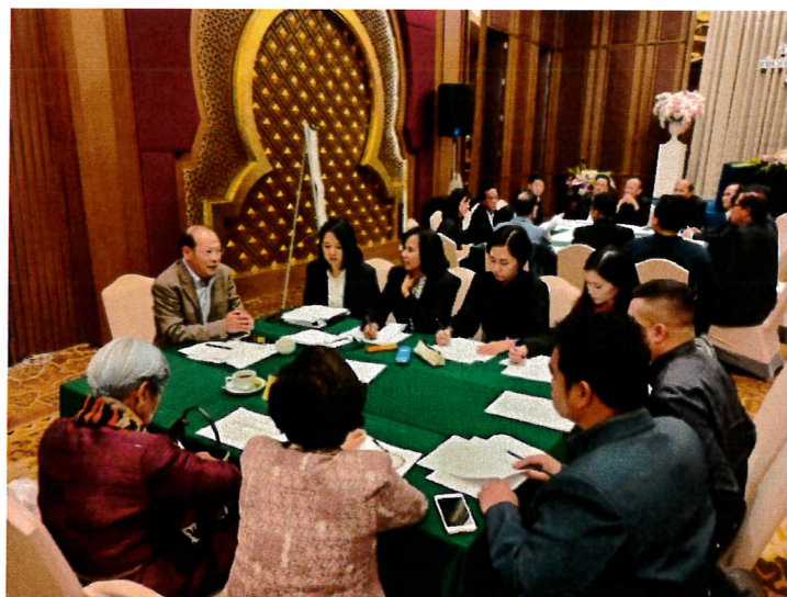
กลุ่มอุตสาหกรรมการท่องเที่ยวกลุ่มรายได้ดีและการท่องเที่ยวเชิงสุขภาพ