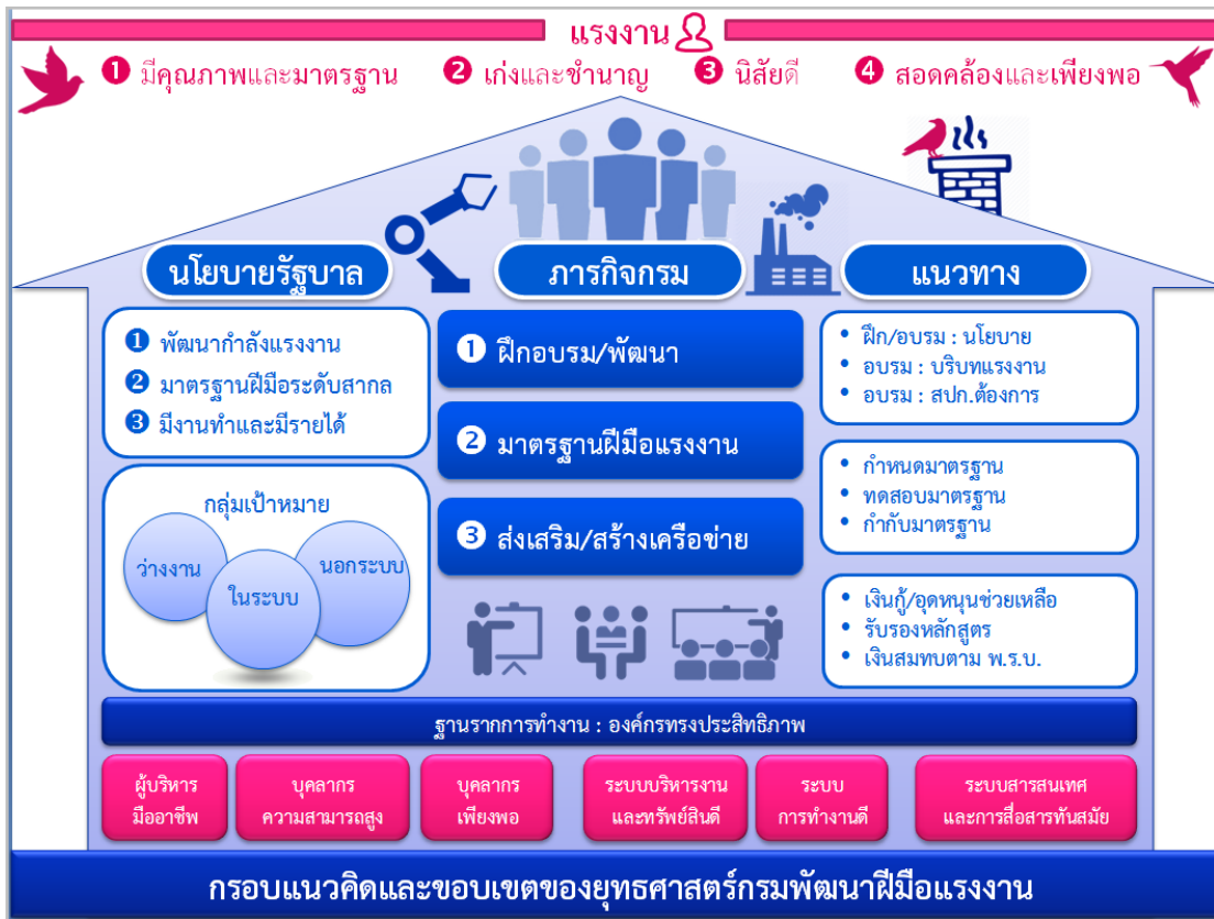
ภาพที่ ๑.๒ กรอบแนวคิดและขอบเขตของแผนยุทธศาสตร์กรมพัฒนาฝีมือแรงงาน พ.ศ. ๒๕๖๐ - ๒๕๖๔ ที่มา : กองแผนงานและสารสนเทศ, ๒๕๖๐