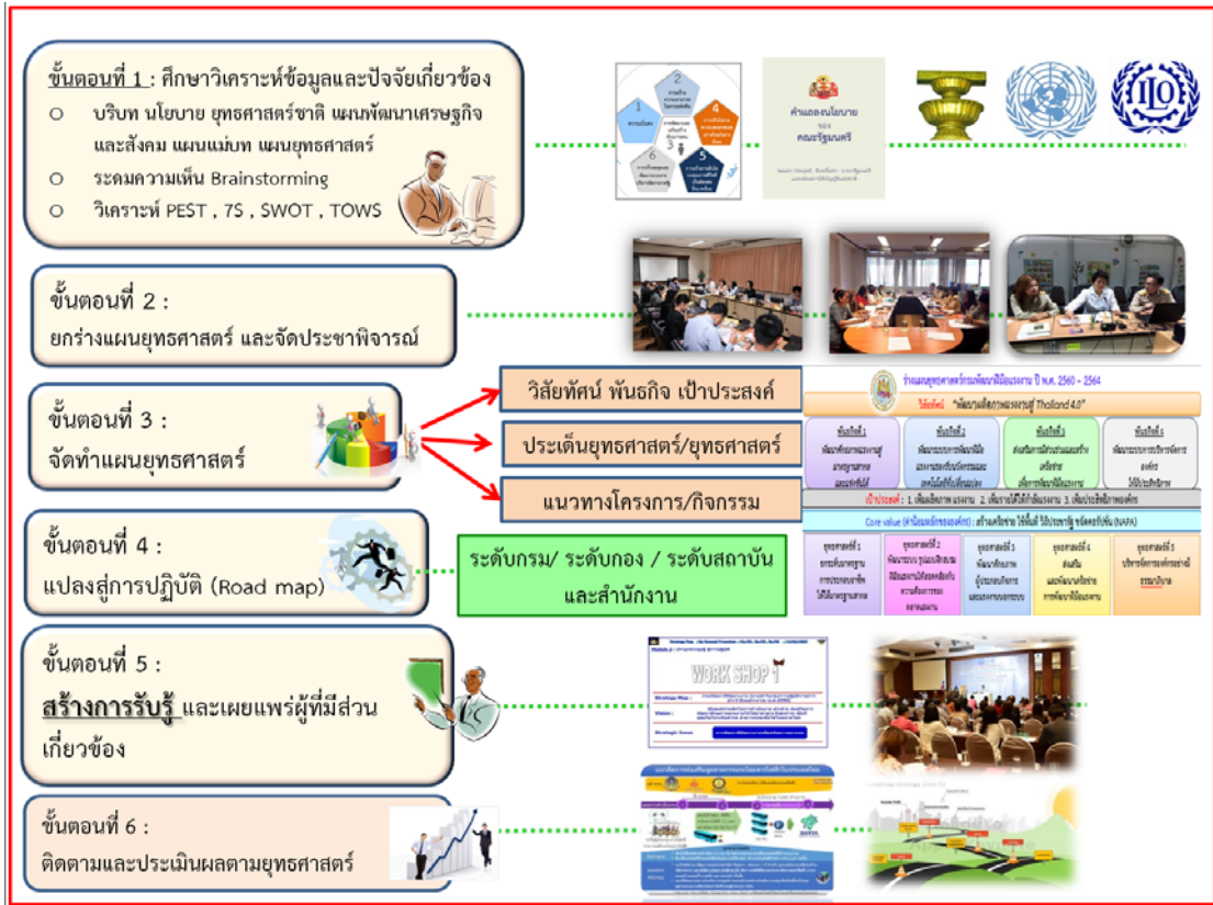
ภาพที่ ๑.๑ ขั้นตอนการจัดทำ (ร่าง) แผนยุทธศาสตร์กรมพัฒนาฝีมือแรงงาน พ.ศ. ๒๕๖๐ – ๒๕๖๔