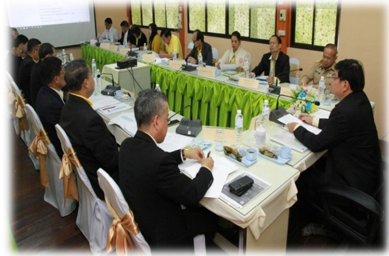
ภาพบรรยากาศระหว่างการดำเนินโครงการเพิ่มทักษะด้านอาชีพแก่นักเรียนครอบครัวยากจน ของจังหวัดแม่ฮ่องสอนที่ไม่ได้เรียนต่อหลังจบการศึกษาภาคบังคับ