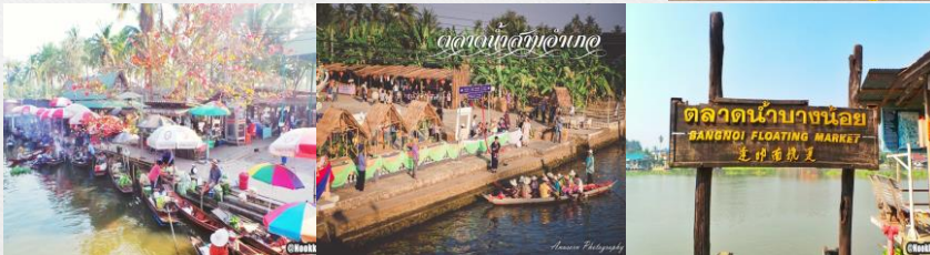
ตลาดน้ำท่าคา ตลาดน้ำสามอำเภอ ตลาดน้ำบางน้อย