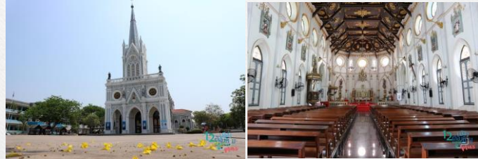
อาสนวิหารแม่พระบังเกิด