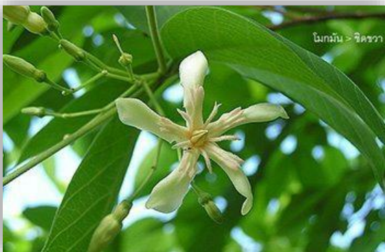
ต้นโมกมันต้นไม้ประจำจังหวัดราชบุรี