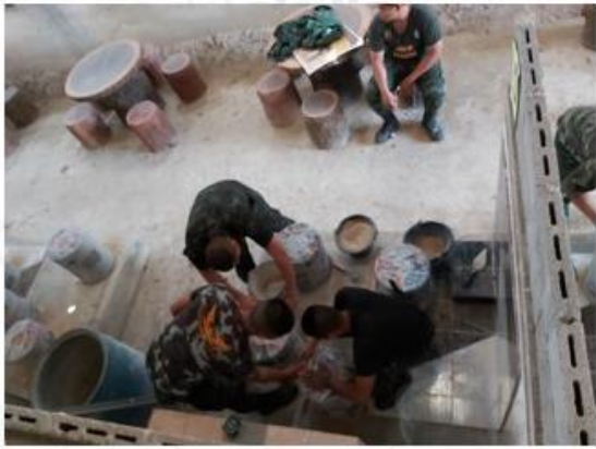
การฝึกอบรมหลักสูตร ผลิตภัณฑ์ปูนปั้นไม้เทียมเพื่องานประดับ (ทหารก่อนปลดประจำการ)