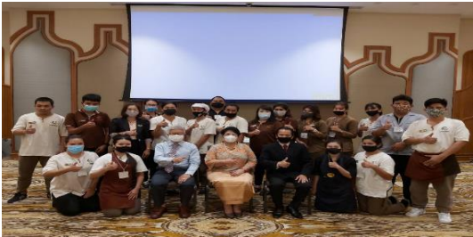
การฝึกอบรมหลักสูตร การสร้างการบริการที่ประทับใจ