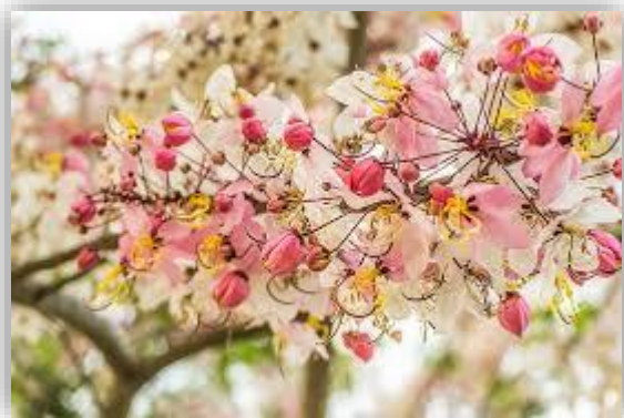
ดอกกัลปพฤกษ์ดอกไม้ประจำจังหวัดราชบุรี