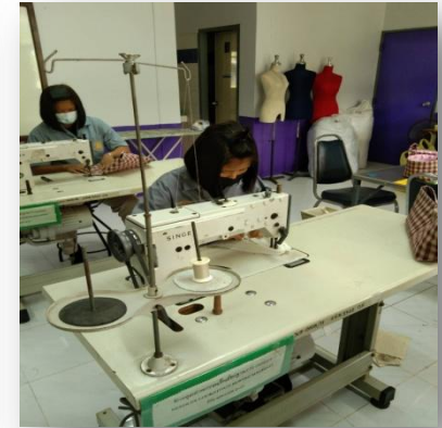
ช่างตัดเย็บจักรอุตสาหกรรม (ผ้า) จำนวน ๓ คน