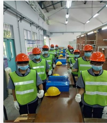
ช่างเดินสายไฟฟ้าภายในอาคาร จำนวน ๑๐ คน

ภาพการดำเนินงาน กิจกรรม เพิ่มทักษะด้านอาชีพแก่นักเรียนครอบครัวยากจนฯ