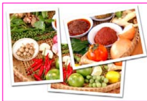
การทำขนมอบ