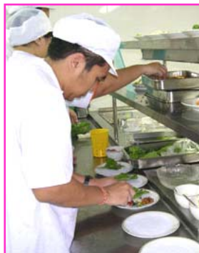
การประกอบอาหารไทย