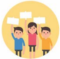
ชุมนุมโดยสงบ