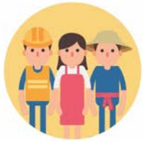
ประกอบอาชีพ