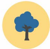
อนุรักษ์พันธุกรรมชาติ