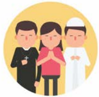
นับถือศาสนา