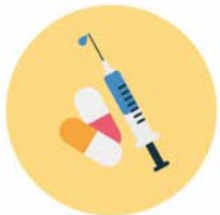
รับบริการสาธารณสุข