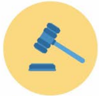
ร้องทุกข์ ฟ้องคดี