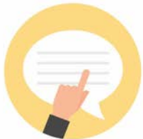
เสนอแนะนำรัฐ