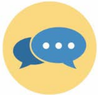
แสดงความคิดเห็น