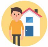
ความเป็นอยู่ส่วนตัว