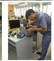
ประมวลภาพกิจกรรมการฝึกเตรียมเข้าทำงาน