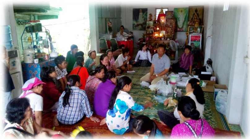
ภาพการทำของที่ระลึกจากสมุนไพรกลุ่มแรงงานงานนอกระบบ