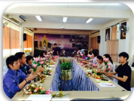
ประมวลภาพผลดำเนินการกลุ่มแรงงานในสถานประกอบการ